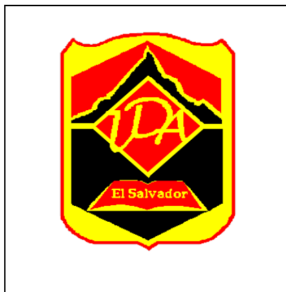
Insignia del Establecimiento